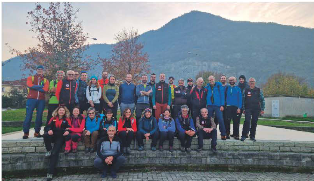
CORSO IVF - Foto di Gruppo