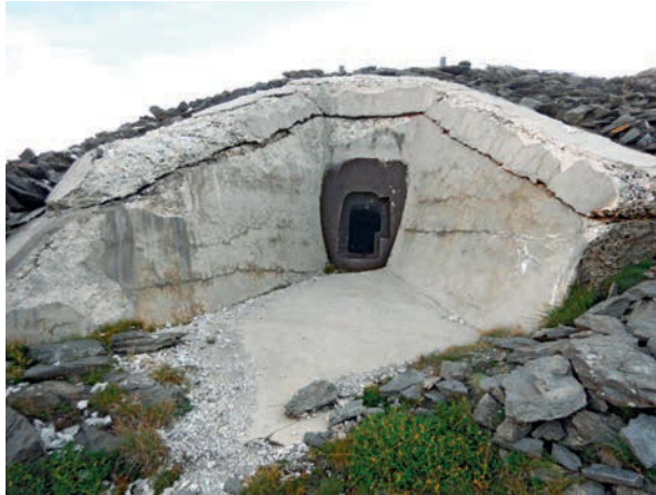
CANNONIERA 617a G.A.F.

torno dopo anni per rivedere un sito minerario alquanto interessante, “Chuc e Servette”, la miniera già sfruttata dai Romani che oggi è diventata un parco a tema, risistemato per garantire all’escursionista di visitare le aree di ricerca in sicurezza. Oltre questo sito continuando l’escursione, troviamo un’altra miniera la “Praborna” dove si estraeva manganese, risalente al 1400 circa.