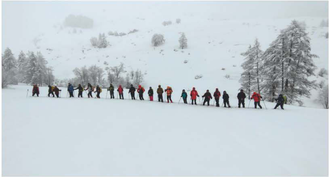
CORSO EAI - 2024 - CREVACOL (AO)