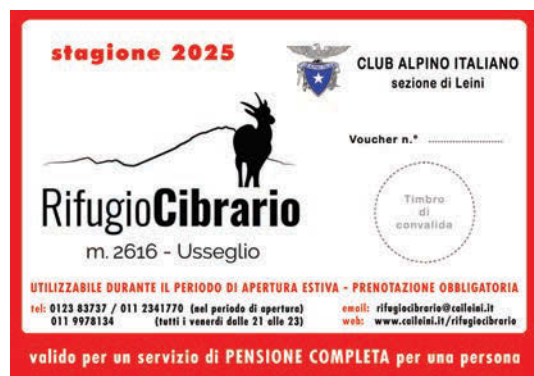
VOUCHER PENSIONE COMPLETA

Anche quest'anno, i soci possono acquistare in sede i voucher per i servizi di mezza pensione e pensione completa per il rifugio. I voucher, acquistabili in sede il venerdì sera oppure ordinabili con pagamento tramite bonifico, sono al portatore e sono utilizzabili da chiunque (soci e non soci) nel periodo di apertura sopra indicato.