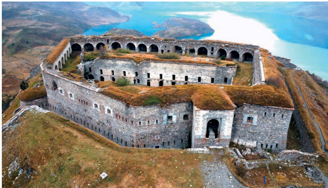
FORTE DI VARISELLE

Rieccoci nuovamente seduti alla scrivania: è giunto nuovamente il momento da dedicare al riassunto dell'attività speleologica effettuata nel 2024, anche quest'anno molto variegata e ricca di nuove scoperte.