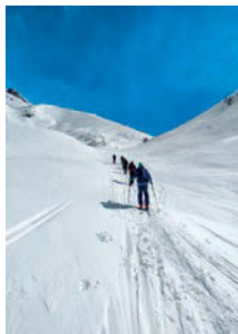
Verso il Monte del Sangiatto