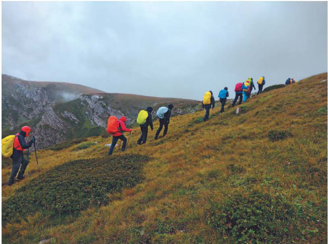
CORSO E2 - VALLE ELLERO