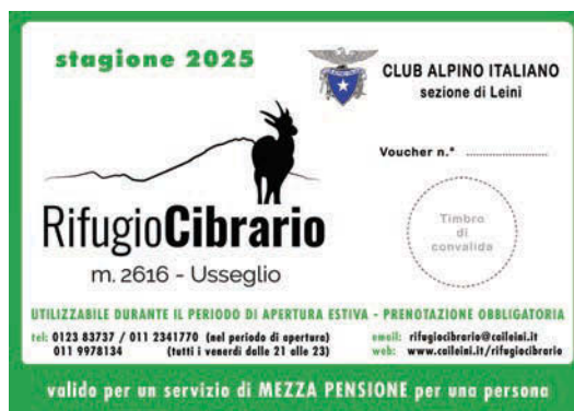
VOUCHER MEZZA PENSIONE