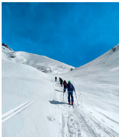
VERSO IL MONTE DEL SANGIATTO

per settembre, le abbiamo dovute sostituire con un weekend in zona Grigne che anche qui si è dimostrata una valida alternativa. Abbiamo percorso la ferrata Gamma 1 ai Piani D'Erna ed il sentiero attrezzato della Direttissima alla Grignetta. In ogni caso le ferrate alle Pale