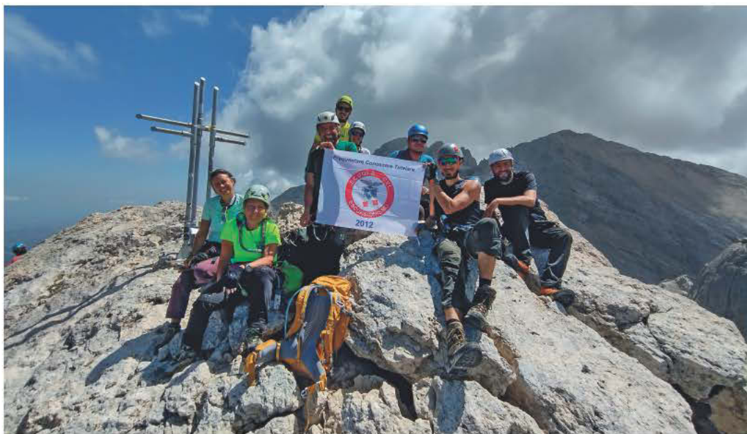
VETTA CORNO PICCOLO, Gran Sasso d' Italia