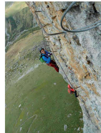
Sabato 2 giugno: Ferrata Rocca Senghi